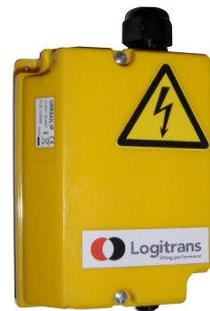
El receptor del control remoto wireless se encuentra en el propio equipo.