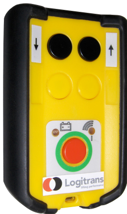
Mando de control remoto wireless RCW 1 de dos direcciones.