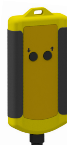
Control remoto por cable para transpaletas con elevación eléctrica (elevación/descenso).