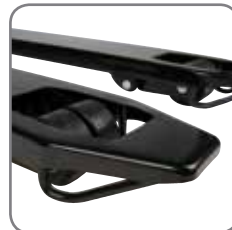
Incorporan patines para entrar y salir de los pallet cerrados sin dificultad.