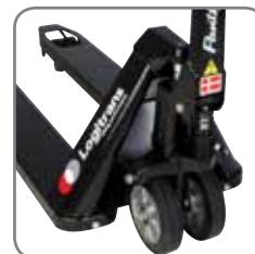
Panther Silent tiene elevación rápida permanente.

También ofrecemos soluciones a medida. Consúltenos para más información o visite nuestra página web www.logitrans.com