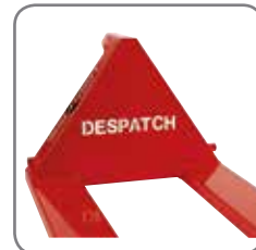
Puede personalizar la carretilla con el nombre/logo/texto y/o en el Color de su empresa.