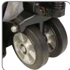
Llantas de especiales de Goma, óptimas para el cuidado de los pisos.