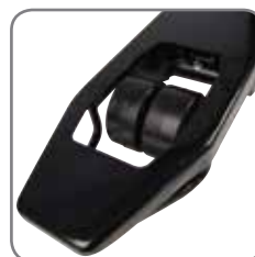
Con las ruedas de carga gemelas es muy fácil cambiar de dirección.