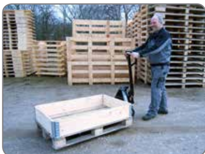
Panther Silent se encarga también del transporte en exteriores.